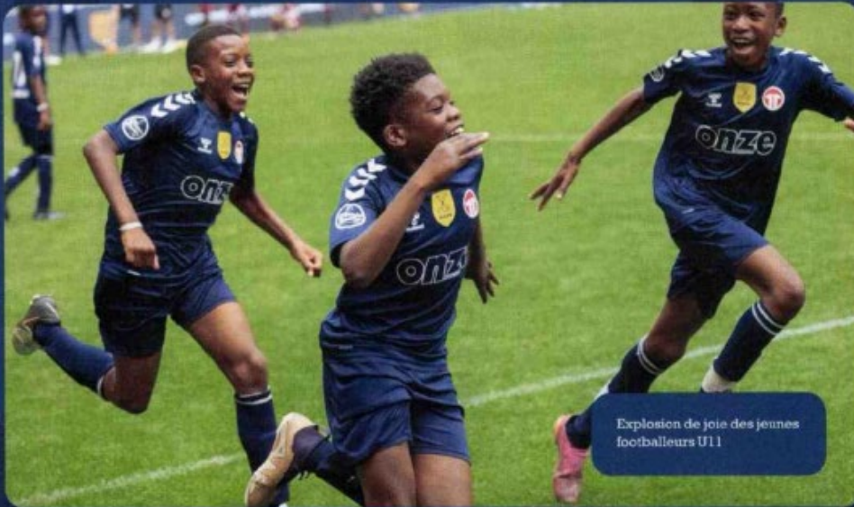
Explosion de joie des jeunes footballeurs U11